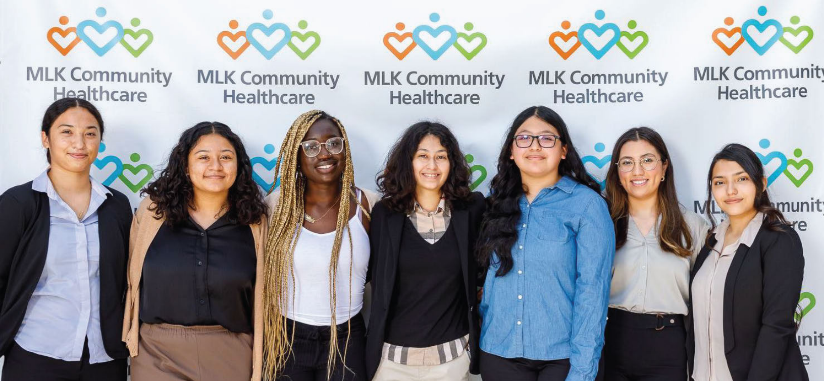
2022 Career Fellows

El Programa Career Fellows estuvo disponible para estudiantes de secundaria en los grados 10 a 12 que asistían a escuelas en el sur de Los Ángeles. MLKCH aceptó a 10 estudiantes de secundaria de escuelas dentro de la comunidad del sur de Los Ángeles y cada estudiante completó un programa de 7 semanas con una jornada semanal de 25 horas por semana. Al final del programa, cada estudiante completó 167 horas. Parte del programa incluía la observación de empleados clínicos y no clínicos. Más de 50 miembros del personal de MLKCH participaron en el programa como tutores de los estudiantes y/o ayudando a los estudiantes en sus rondas de departamento.